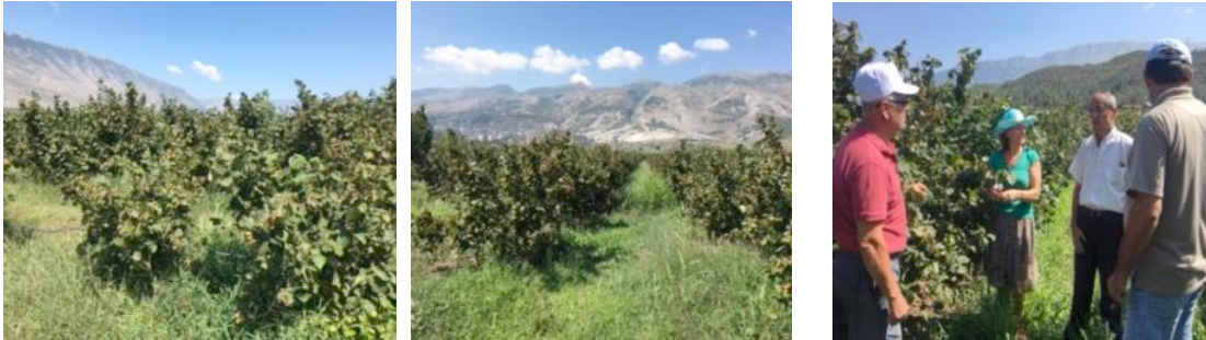
Figurë 1. Foto nga puna e stafit të projektit në parcelën e mbjellë me lajthi

Agronomëve ekstensionist iu vu në dispozicion dosja e projektit që përmbante projektin, kontratën, fletoren e fushës. Fermerit ju vu në dispozicion kryerja e analizave të tokës (përmbajtja e elementëve ushqyes si dhe nje sasi plehu kimik NPK (50kg). Kjo u realizua me fondet e projektit.