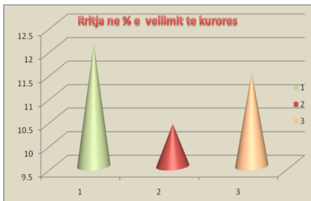
Grafik 1. Paraqitja grafike e rritjes në % të vëllimit të kurorës

Për treguesin e vëllimit të kurorës për të tre format e mbajtjes së kurorës nuk ka shumë ndryshime përsa i përket rritjes në % të vëllimit të kurorës.